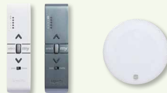
Situ 5 VAR A/M io