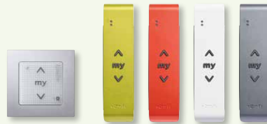
Smoove 1 io